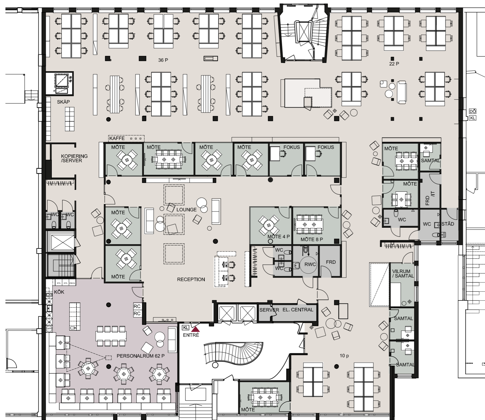
GATUPLAN (1/2 PLAN ÖVER GATUNIVÅ)