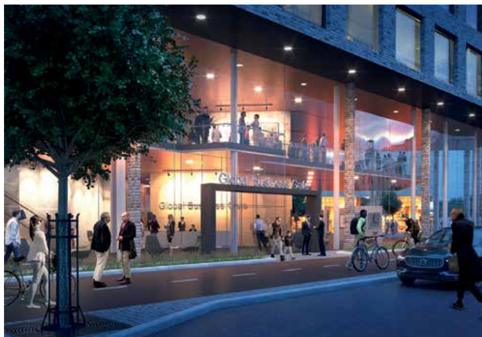
LIVFULLT. Masthuggskajen blir en ny levande stadsdel nära Järntorget och Långgatorna.